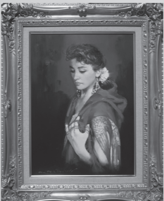
【新作】バレセロナ“想い” P8号 油彩

会場 矢尾百貨店 3階催事場 秩父市上町1丁目5-9 TEL 0494-24-8080