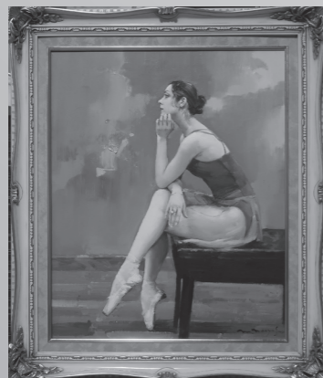
【新作】オクサーナの休息 F15号 油彩